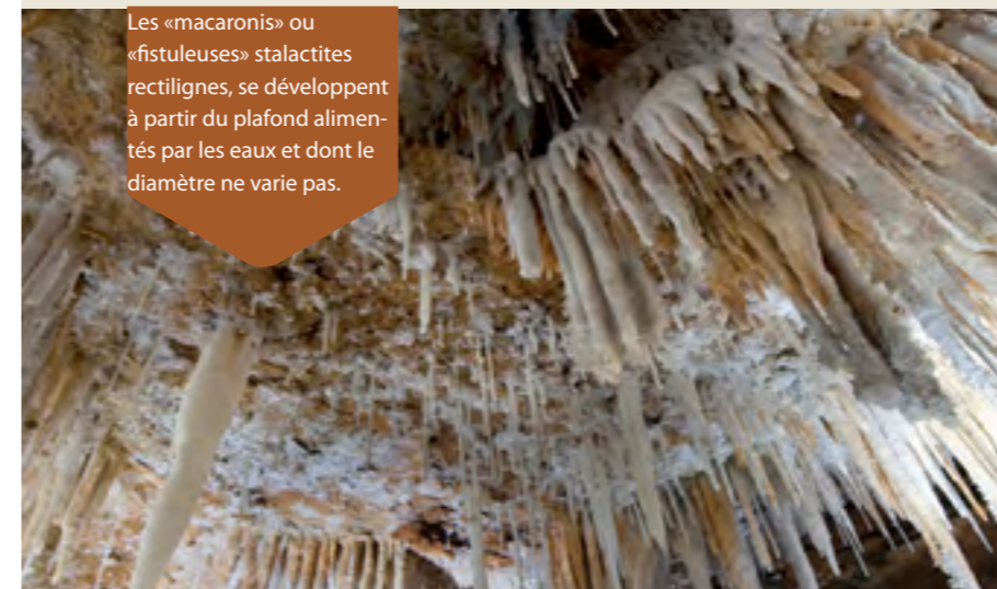
Les «macaronis» ou «fistuleuses» stalactites rectilignes, se développent à partir du plafond alimentés par les eaux et dont le diamètre ne varie pas.