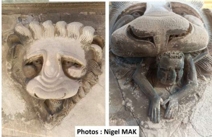
La Tête de Lion - 3 rue ancienne ville

Les recherches sur le patrimoine du village continuent avec le groupe « Histoire(s) » qui compte s'attaquer cette année aux vestiges des fortifications du XII e siècle. Vous êtes les bienvenus pour nous rejoindre si vous êtes intéressés ( mintchvidal@gmail.com ). L'année 2026 verra peut-être les prémices du relèvement du pigeonnier de Ginetous, en association avec « lo Picart ».