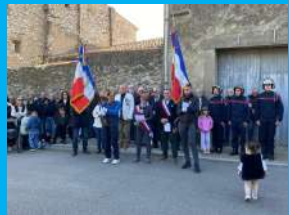
Commémoration du 11 novembre 1918 Page 6