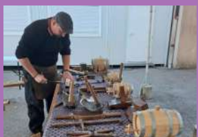
La tonnellerie à l'honneur Page 16