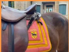
La Route du Sel de retour à Saint Jean de Fos Page 10