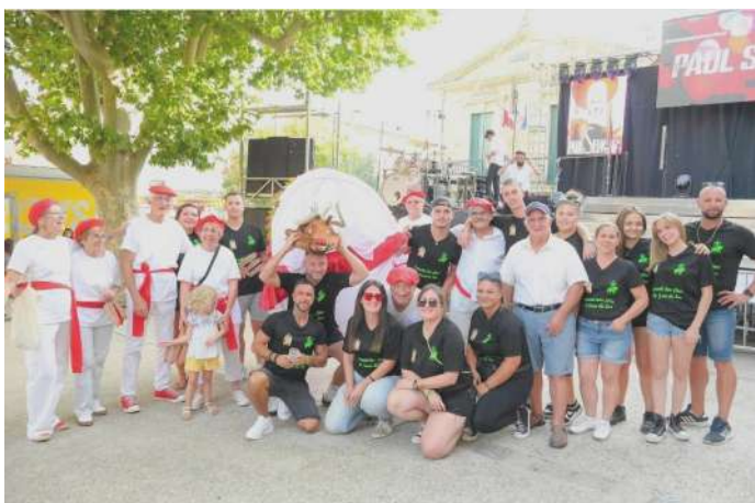
Notre animal totémique « Lo Picart » était de sortie pour le premier jour de la fête du village

Le Comité vous donne à tous rendez-vous pour une nouvelle année festive !